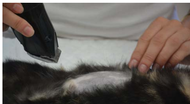
Pred posegom kirurško polje obrijemo in razkužimo.