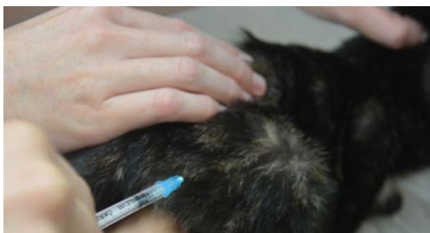
Poseg vedno opravljamo v splošni anesteziji.