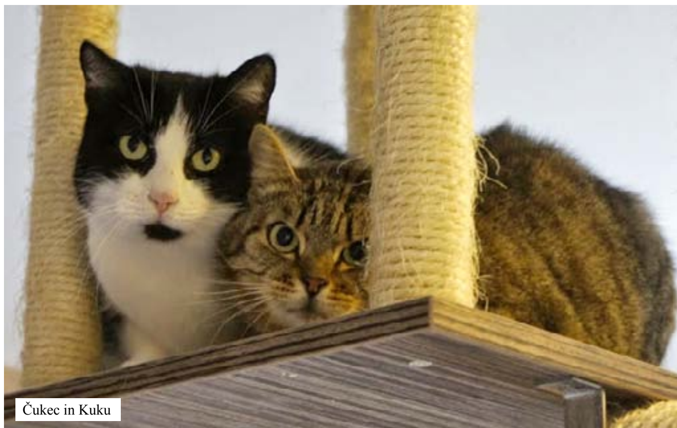
Čukec in Kuku

Ob upoštevanju teh nasvetov ter podpori skrbnic Mačje hiše, ki so posvojiteljem vedno na voljo, predsem pa ob dejstvu, da so muce polne presenečenj, je lahko življenje z (nekoč) plašno mucu nadvse osrečujoče. O tem najlepše govorijo pričevanja tistih, ki so znali gledati mimo prestrašenih fotografij in so v svoj dom sprejeli takšno mucu. Zbrali smo nekaj teh pričevanj, ki morda prepričajo še koga in tako osrečijo še kakšno mačjo in posvojiteljsko dušo.